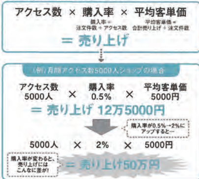
●図4 ネットショップの「売り上げの公式」