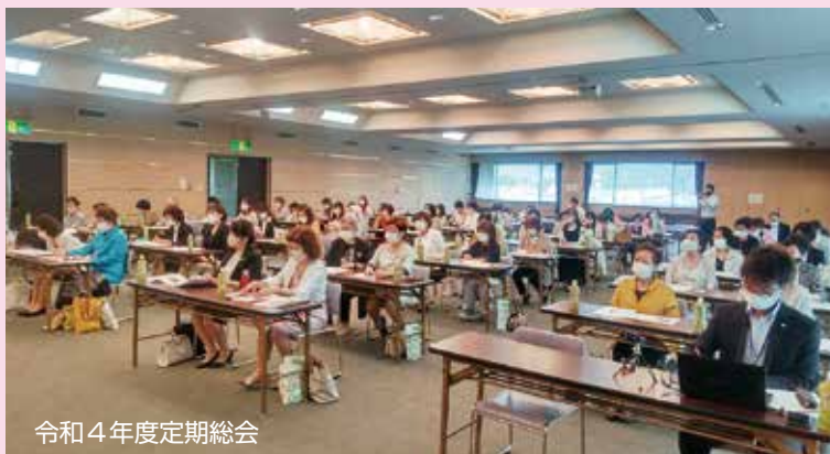
令和4年度定期総会

4月13日、福井県商工会議所女性会連合会役員会に出席しました。定期総会提出議案「令和4年度事業報告書及び収支決算書承認、令和5年度事業計画書(案)及び収支予算書(案)」が協議され、原案の通り承認されました。定期総会は5月26日小浜市で開催されます。