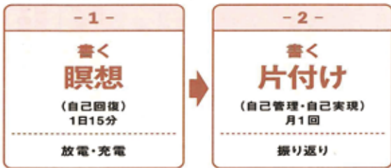
●図1 「書く瞑想」と「書く片付け」

日々の仕事や生活に追われ、やりたいことができないと悩むビジネスパーソンも多いだろう。そこで、1日15分、紙に書き出すだけで、自己管理・自己実現ができる「書く瞑想」法を解説する。