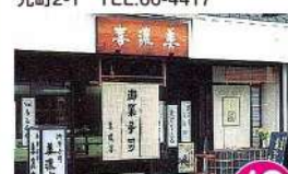
12 美濃喜 明倫町10-23 TEL.66-2086