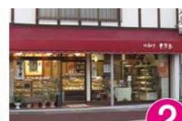
2 手作り工房豊栄堂 要町2-14 TEL.65-7088