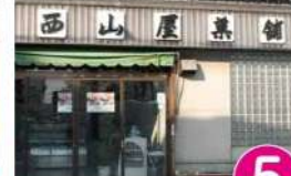
5 西山屋菓舗 本町8-22 TEL.66-2520