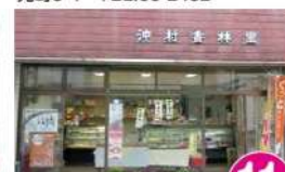
11 沖村香林堂 明倫町10-20 TEL.66-2608