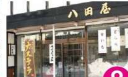
8 有八田屋 元町8-4 TEL.66-2482