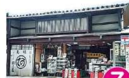
7 七間朝市通り朝日屋 元町2-7 TEL.66-2975