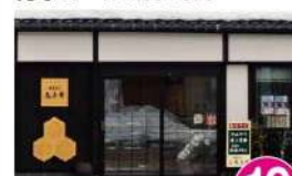
10 有亀寿堂 元町2-1 TEL.66-4417