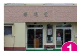
1 陽明堂 陽明町3-406 TEL.66-5388