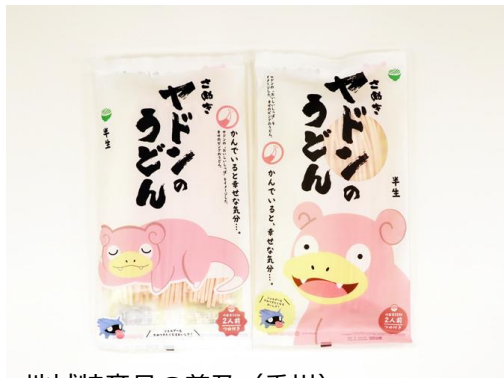
地域特産品の普及 (香川)