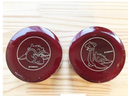
地域伝統工芸・玉虫塗 の普及 (宮城)