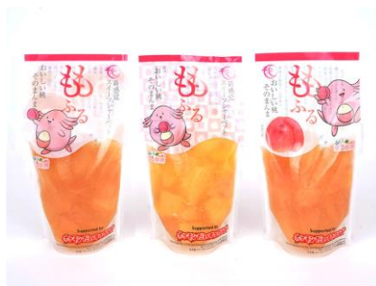
地域特産品の普及 (福島)