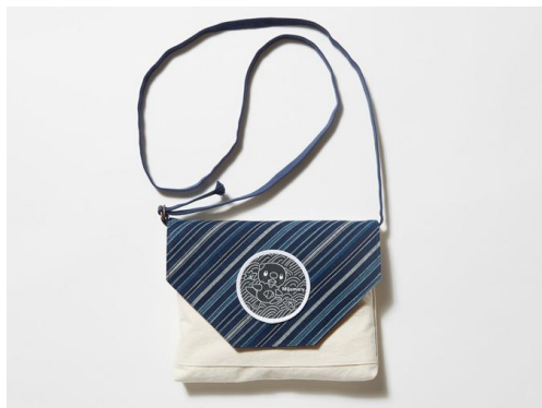
地域伝統工芸・みいと織の普及 (三重)