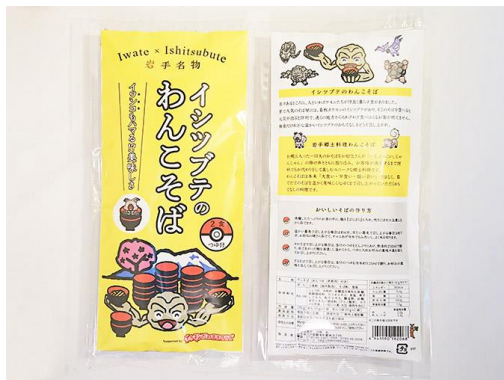
地域特産品の普及 (岩手)