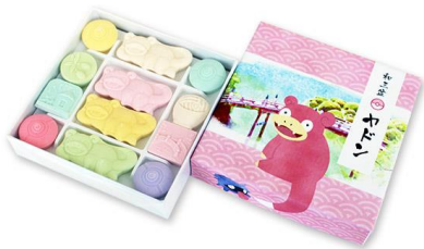
地域特産品の普及 (香川)